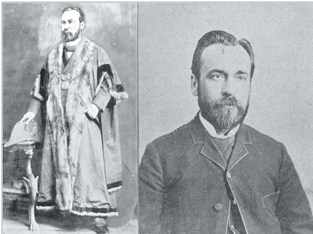
Photo de Hormidas Laporte alors maire de Montréal (gauche) et vers les 1904 et alors commerçant fin du 19e siècle. (droite)

Sir Hormidas Laporte est décédé à Montréal le 20 février 1934.