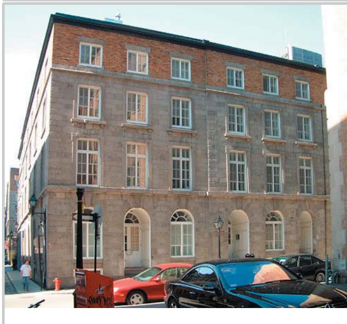
Vue des magasins-entrepôts Carter vers 1905 alors que Laporte, Martin & Company, épiciers de gros, les occupent.